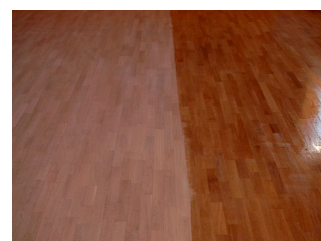
5. Gulvet slipes og lakkes