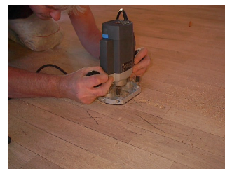
2. Utfresning av lameller