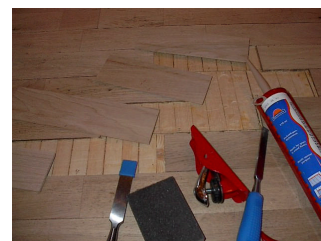
3. Gamle lameller er fjernet